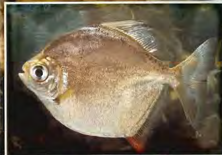
Pakoussine C - Pakoési S - Mabé N