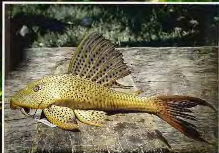
Goré jonn C - Wawa N