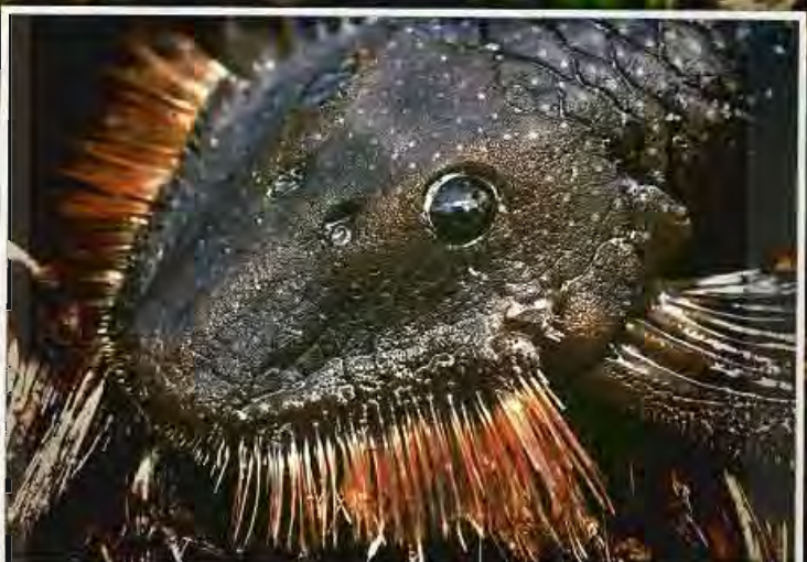
Goré so C - Pataede wawa N