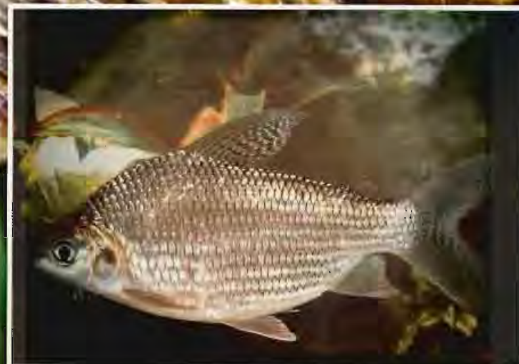
Coulilata C - Koumata N