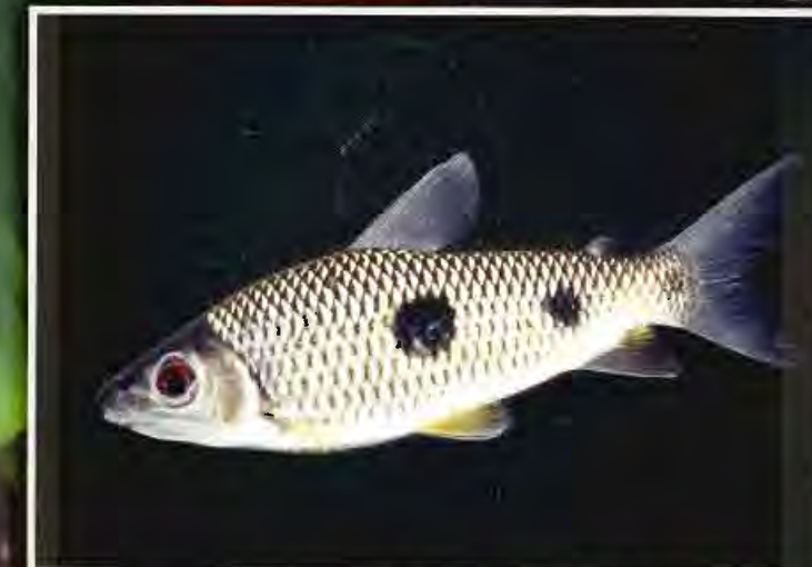
Karp jonn C - Warakoe S - Weti wakou N