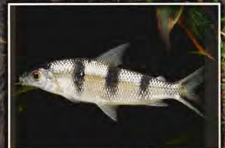
Parasi So C - Kwasimama N