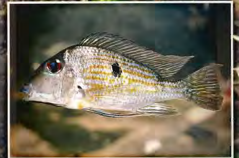
Prapra soleil C - Sanfisi N