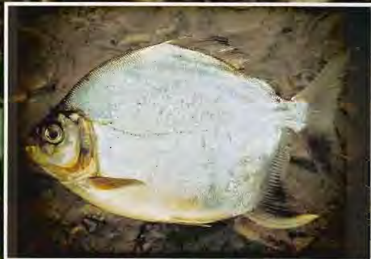
Koumarou C - Weti koemaloe N

Ces poissons* non prédateurs pauvres en mercure peuvent être consommés sans risque.