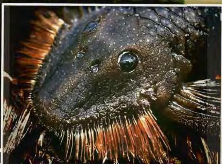
Goré so C