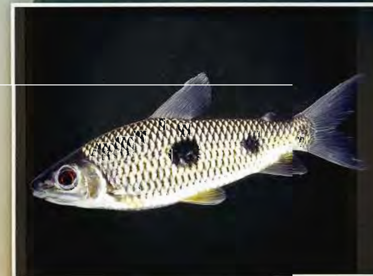
Karp jonn C