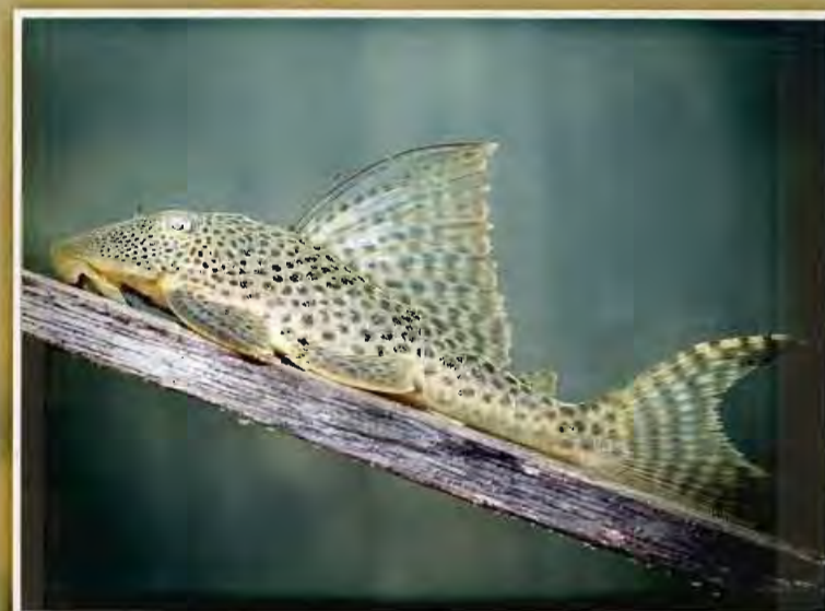
Goré rivier C