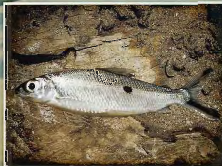
Banan, Parizien C