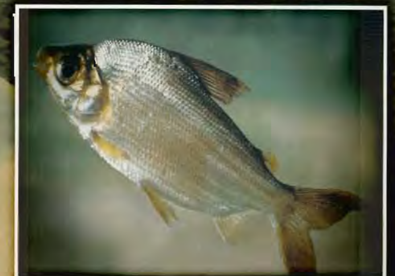
Yaya grojé C