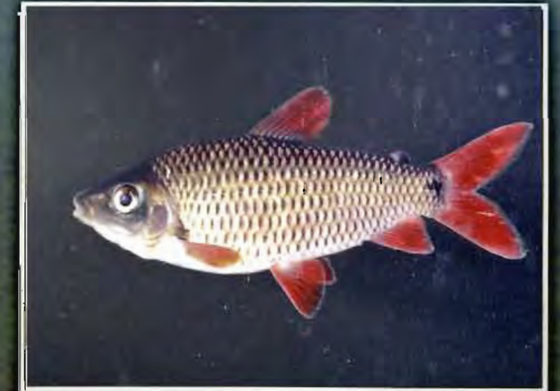
Karp rouge C